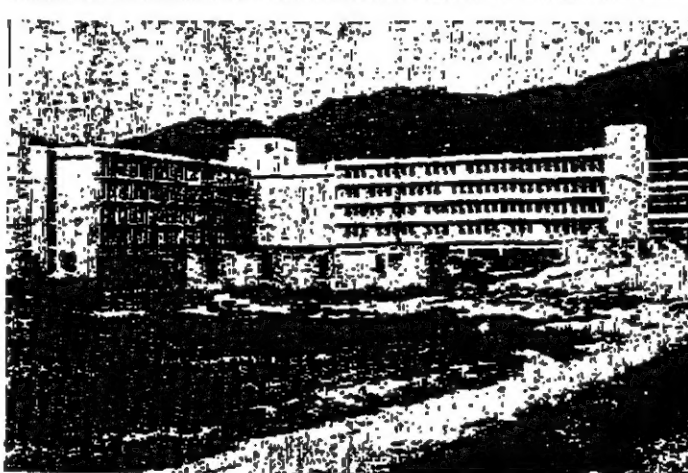
جانب من مدينة اسلام آباد عاصمة باكستان

في ديار الحرب ان تحقق غلبتها ايدا ، وان ما نتجته يد الاستعمار في فلسطين ستفضه الاجيال المؤمنة حتما ... ولو بعد حين . وزارة لتحرير الاعلام ووصلت الى كراتشي بعيد منتصف الليل بقليل وقضيت فيها ليلة واحدة ، قبل ان اغادر باكستان في اليوم التالي الى ايران . وقد استطعت ان اجتزى من وقتي بضع ساعات زرت خلالها مديرية الاعلام ، وطبقة الحكومة وصمما كيرا تسج الهدايا والنصح . وكان الجو في كراتشي لا يطاق من شدة الحرارة ، وبت لي المقهى في الشهر الصيف جنة يحن اليها الضال ، بالقسبة لاجسيم كراتشي . شيء في السياسة وخلا وجودي هناك كانت بعض قطع الاسطول السوفياتي تروى المدينة وكان البحارة السوفيت يملكون التوافقهم ينظرون نحيت اقاصم ويتجولون لشراب الهدايا والنصح . واحب هذه المناسبة ان ابد السطورة السائلة في الاعان بعض العرب ، من ان باكستان دولة « تدور في فلك الغرب » بسبب قوتها